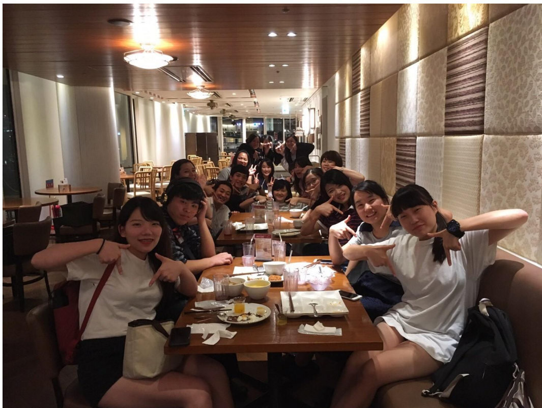
最後一次一起吃飯(2017/08/25)