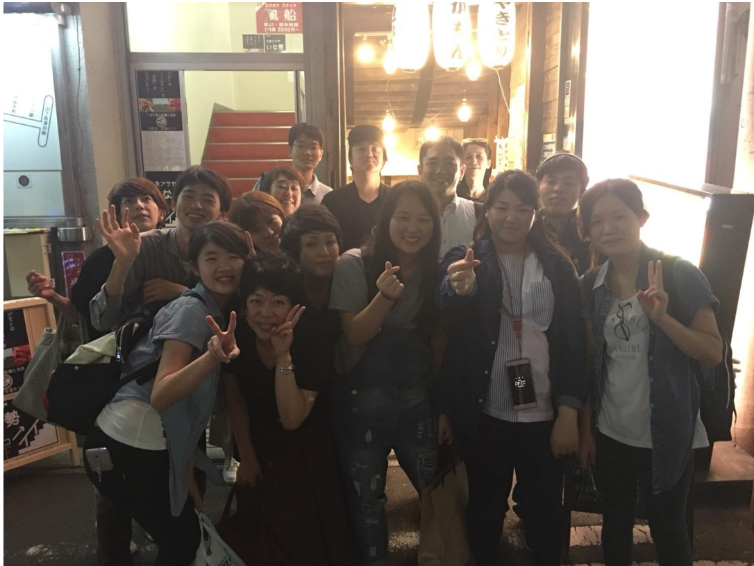
部門幫我們辦的送別會(2017/08/29)