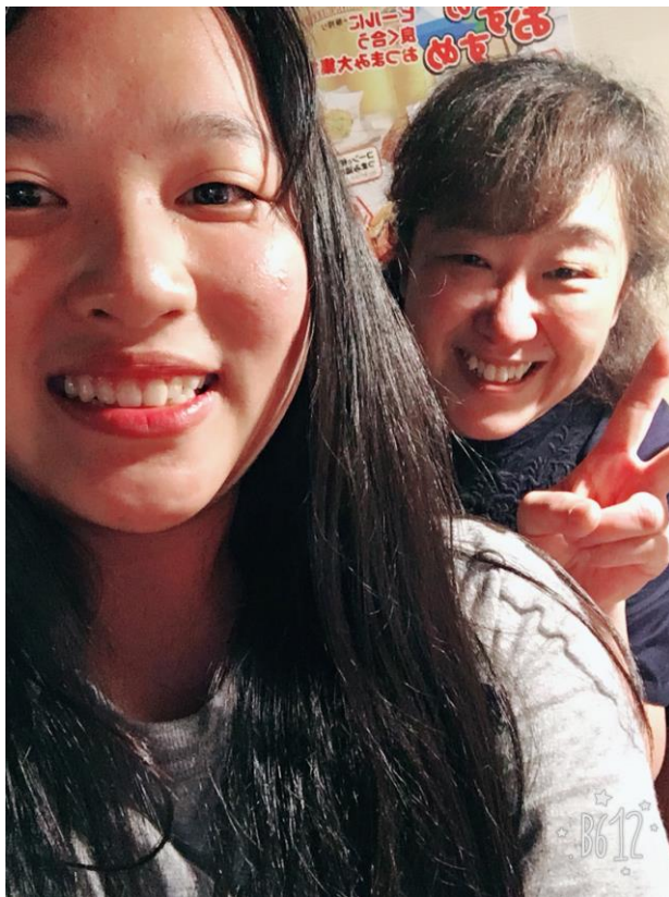
部門幫我們辦的送別會(2017/08/29)