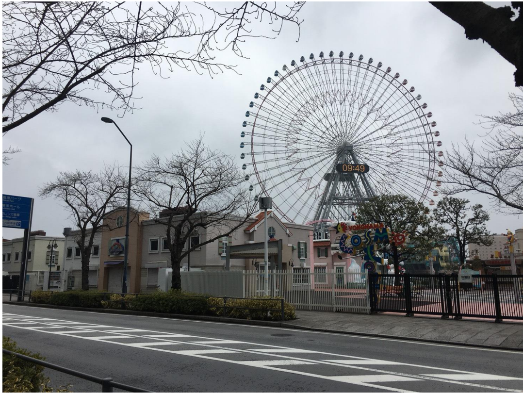
冬天時公司旁邊的景象(2017/03/02)