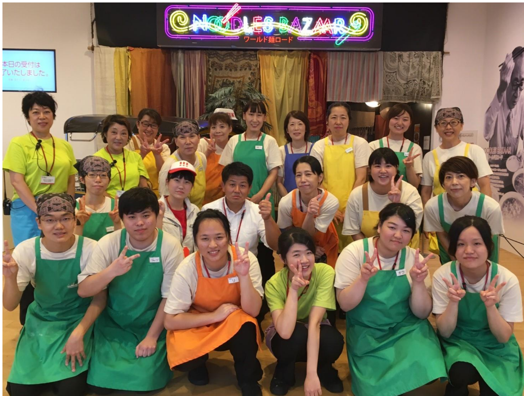
跟部門的同事合照(2017/08/27)