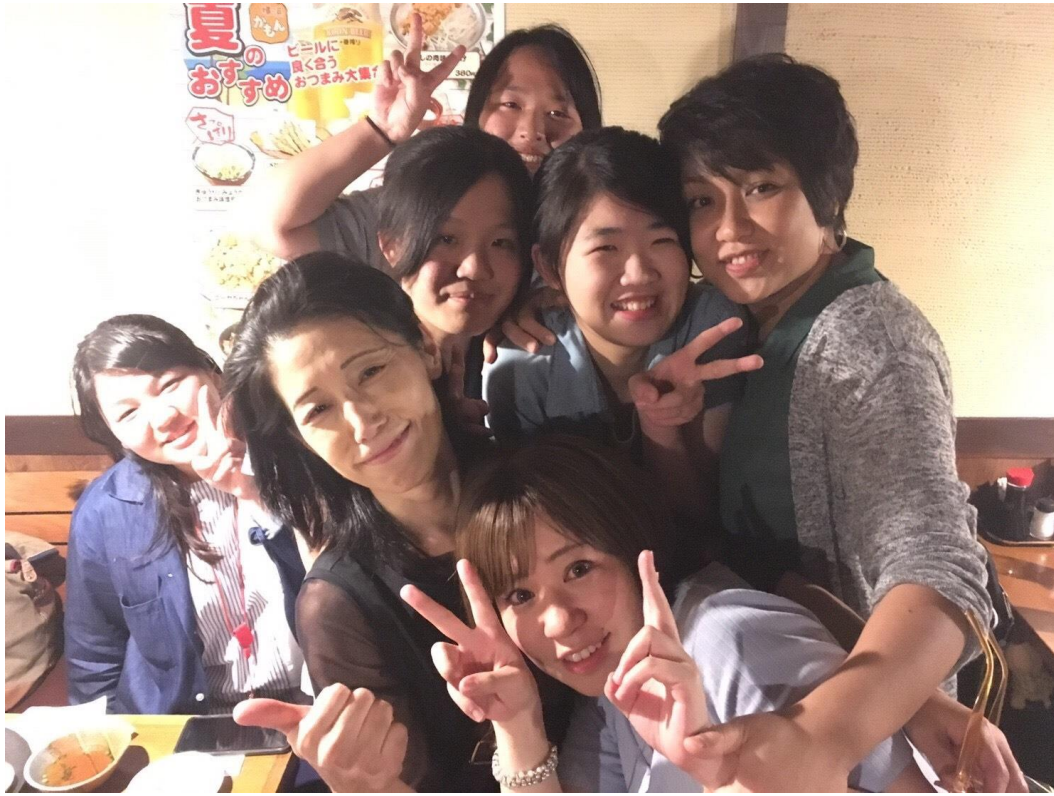
部門幫我們辦的送別會(2017/08/29)