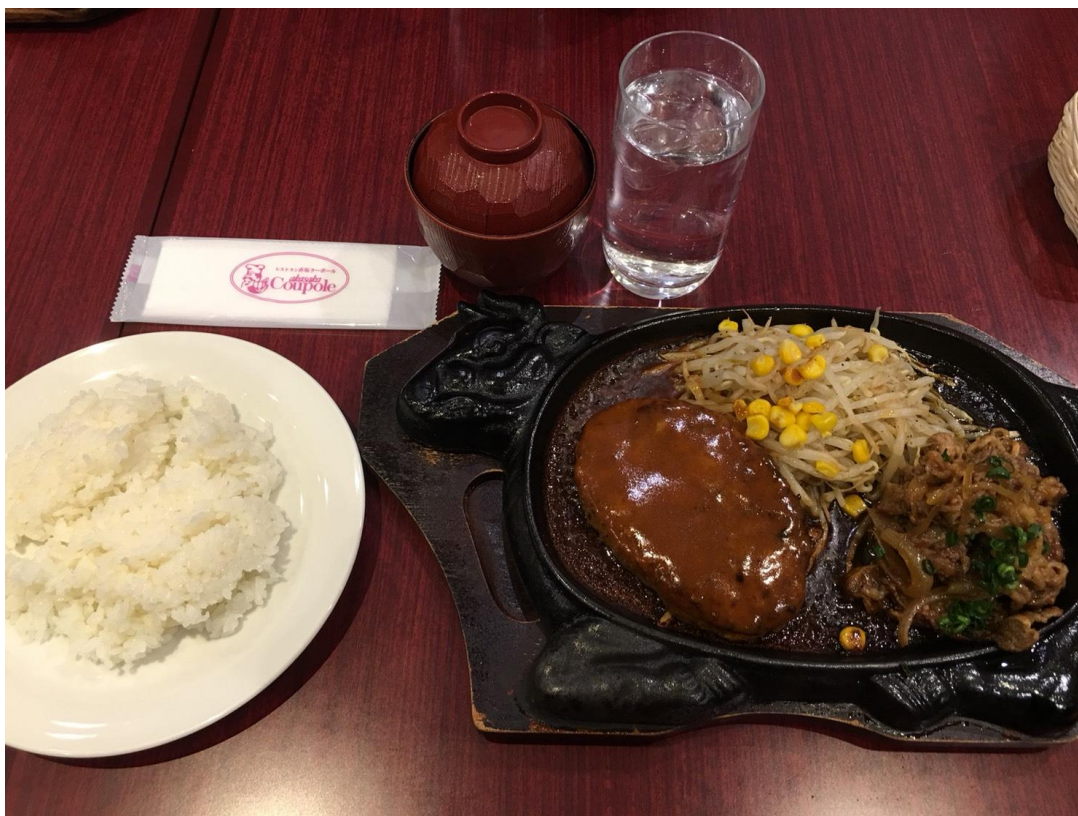
入社式時吃的午餐(2017/03/03)