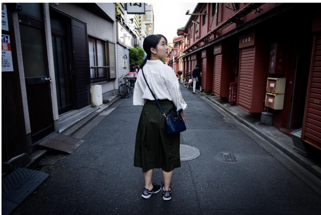
練習人像時拍的同学(2017/05/30)