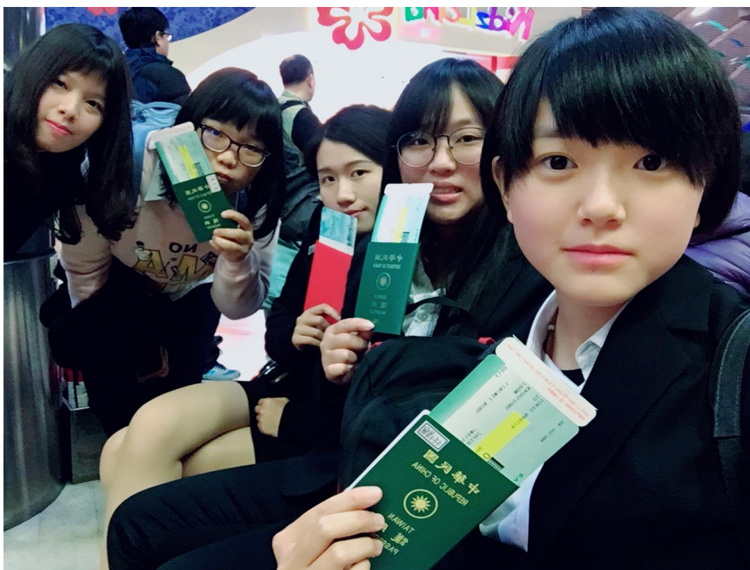
在小港機場滿懷期待的我們(2017/02/28)