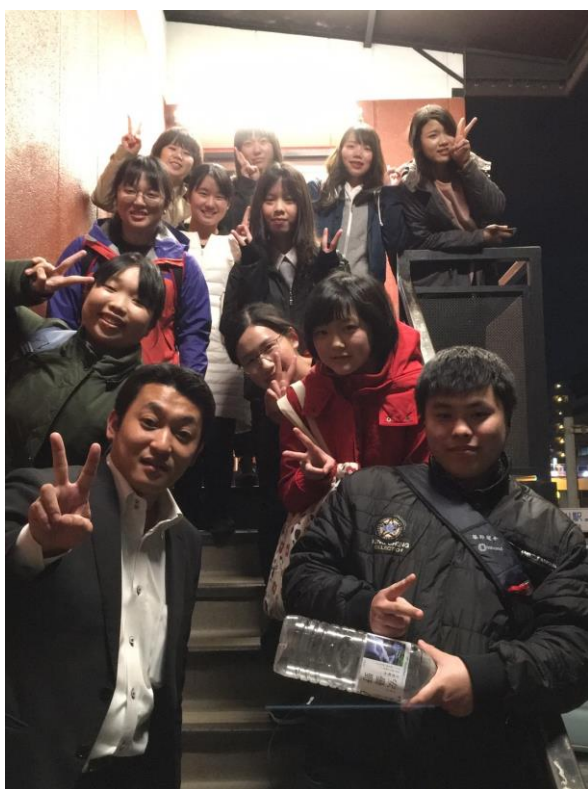
大家一起吃迴轉壽司(2017/04/12)